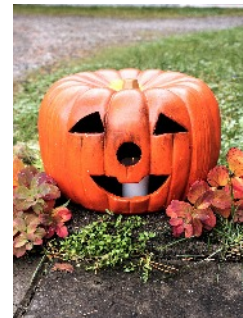
Kannen kuva © Niina Heliranta