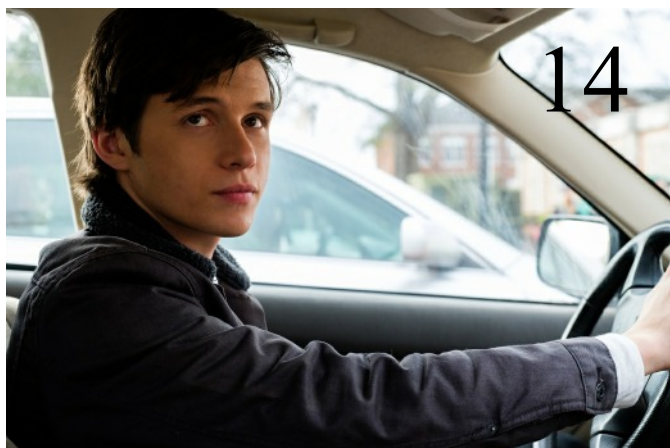
Kaiku-kinossa arvioidaan elokuva Love, Simon.