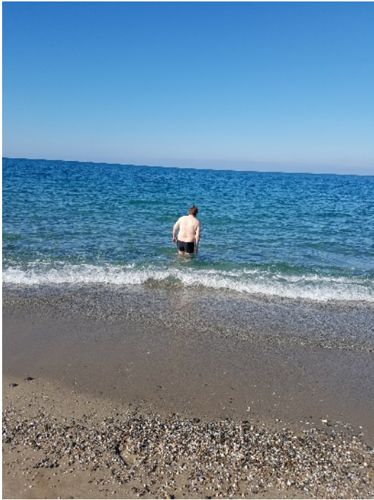
22.10.: Sunnuntaina kävin Välimeressä uimassa.