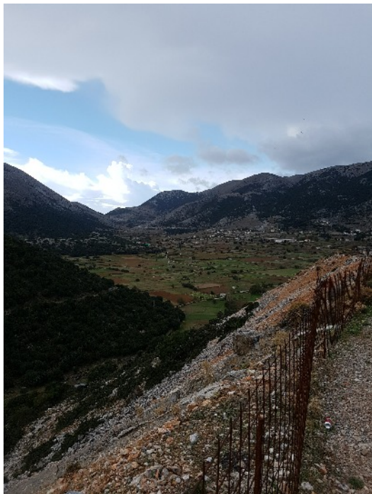
25.10.: Tässä on maisemakuva samalta retkeltä.