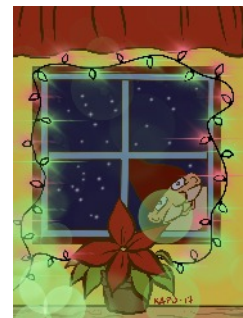
Kannen kuva © Kapu Matilainen

”Tulee mieleen lapsuusjoulut. Kuusi etsittiin metsästä. Hyväntuoksuisia ruokia laitettiin. Tehtiin lumesta lyhtyjä, ja ne loistivat kauniisti. Piparit tuoksuiivat hyvälle. Saunottiin, rapsuteltiin vastalla. Joulupukki tuli illalla, lahjat jaettiin, uskoin silloin vielä joulupukkiin. Kivoja lahjoja saatiin. Kynttilät loistivat kauniisti. Jeesuksen syntymäjuhla muistuu mieleen. Nimimerkki, lapsuuden joulut.”