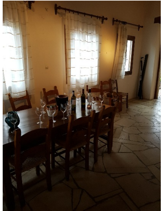
25.10.: Keskiviikkona Kreetan ympäryretken yhteydessä käytiin viinitilalla.