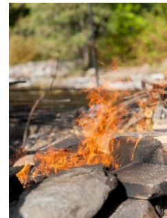
Kannen kuva